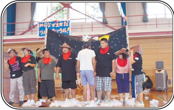
▲聖家族園 運動会 「笠地藏の劇をしました。」