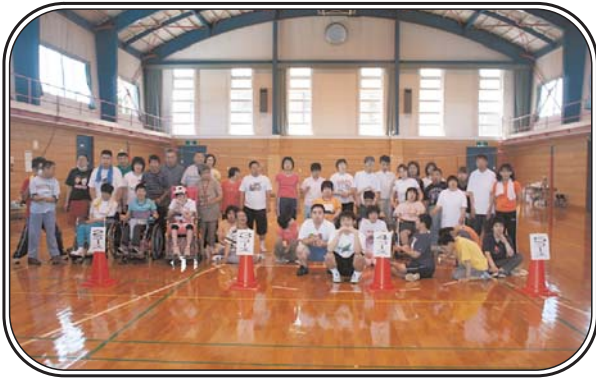
▲聖家族作業所 スポーツ大会（7月16日） 「スポーツ大会が始まるよ！はいチーズ！」