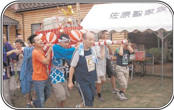
▲第10回佐原聖家族園 納涼祭 「ワッショイ!ワッショイ!」 手づくりのおみこしだよ☆