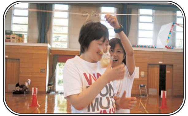
▲聖家族作業所 スポーツ大会（7月16日） 「やったあ！パンげっとお!!」