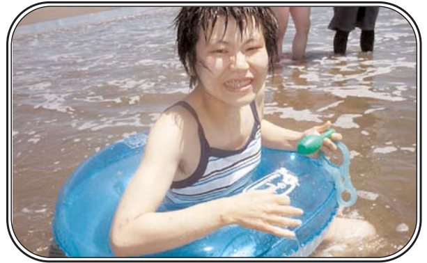
▲聖家族園 海水浴 「海水浴に来ました。」