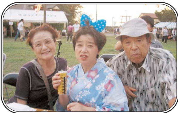
▲第10回佐原聖家族園 納涼祭 「浴衣姿！すてきでしょう？」