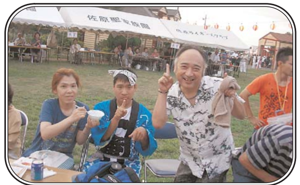
▲第10回佐原聖家族園 納涼祭 「トウース」おいしい食卓。楽しいひとときをすごせて良かった。