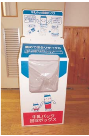
牛乳回収ボックス

現在では、しおり・ぼち袋等を作成し、しおりについては旭市内の図書館や書店に置かせていただいています。市民の皆様にもリサイクル活動について知っていただけたらと考えています。