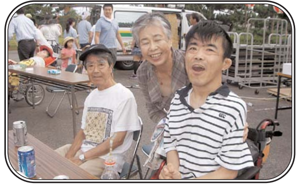
▲聖マリア園 納涼祭 「いっぱい楽しんでます！」