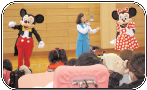
「アンバサダーの紹介でミッキー・ミニーの登場です！」