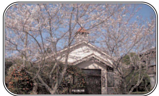
「昭和初期に本会の礎を築いた戸塚神父の記念館前の桜です。」(H 24.4.6 撮影)