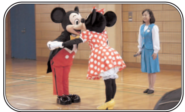
「音楽に合わせてミッキー・ミニーがダンスを披露してくれました♪」