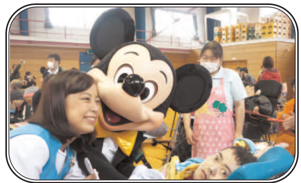
「目の前にミッキーが来ると驚きの表情です！」