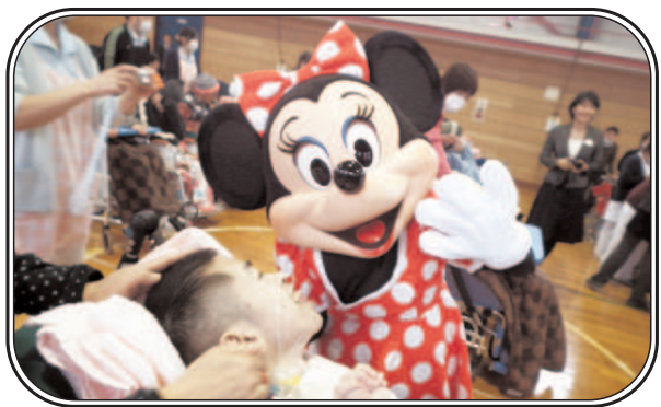
「ミニーが傍に来てくれてドキドキです！！」