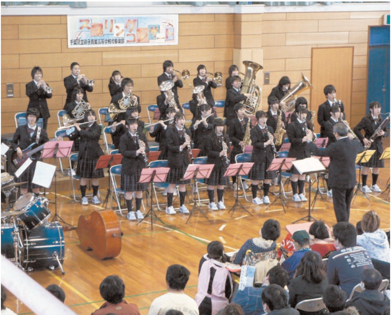
今年8回目を迎えた銚子商業高校吹奏楽部によるスプリングコンサート

社会福祉法人 ロザリオの聖母会 千葉県旭市野中4017 Tel (0479) 60-0600 ホームページアドレス http://www.rosario.jp Eメールアドレス honbu@rosario.jp