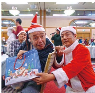
お待ちかね、 プレゼントタイム!