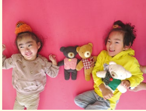
ロザリオ発達支援センター