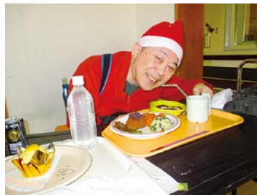
美味しそうな食事に思わずニッコリ♡