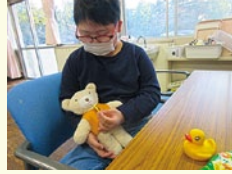
聖ヨゼフつどの家