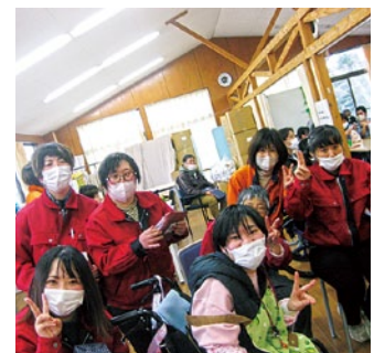
みんなの家忘年会