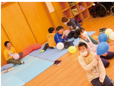
全国のお友達と繋がり、風船を使って体を動かしました♪