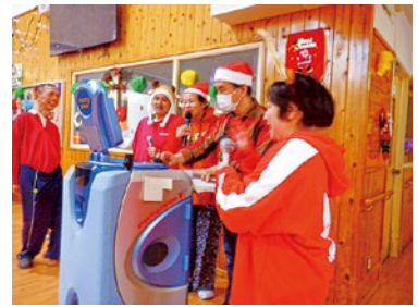
カラオケで大熱唱!