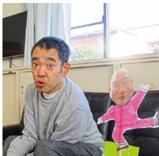
忘年会のテーマは ハリウッド映画!