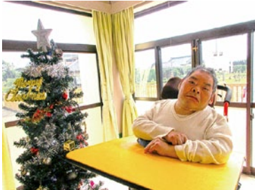
ツリーの前でハッヤリ♪