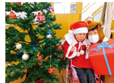
みんなでクリスマスツリーの飾り付け