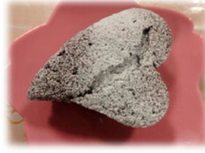
ガトーショコラ 1ホール¥1500