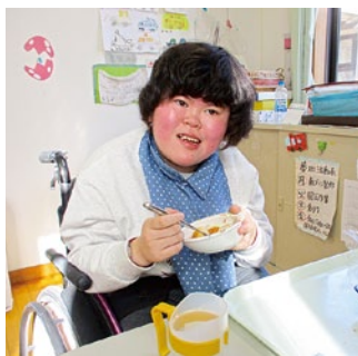
特別なお弁当美味しい!