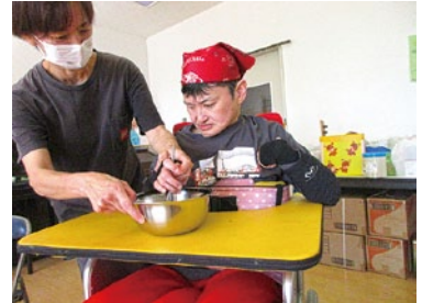
美味しく出来るかな?!