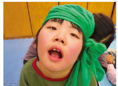
放課後の活動にてスカーフを使用し、ファッションショー!