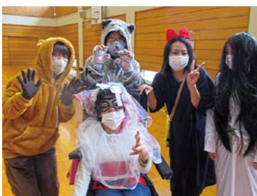
ハッピー ハロウィン🍬