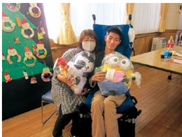
ピンゴで大当たり!