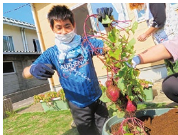
5月に植えたサツマイモの収穫をしました!