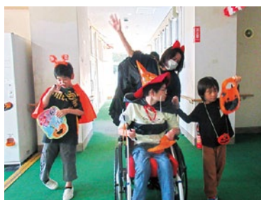
さあ!パーティー! レッツラゴー( ^ ^ )