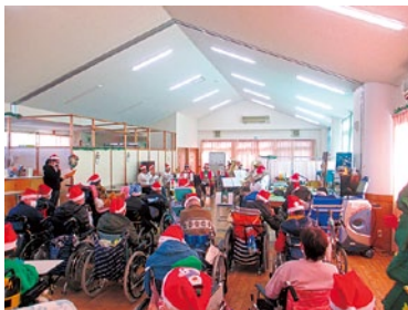
素敵な演奏をありがとうございます☆