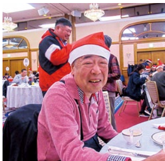
ご家族参加のクリスマス会で 満面の笑み( ^ ^ )