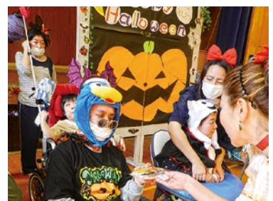
ハロウィンパーティー🍬