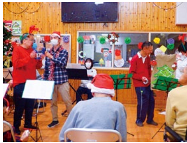
音楽クラブは 今年も盛り上がりがあります!